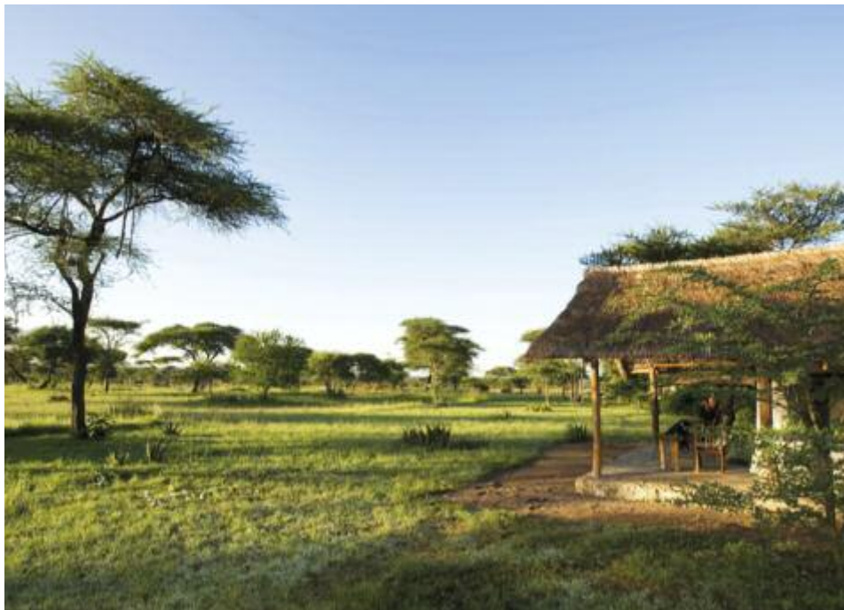
Naturnahe Lodges und Unterkünfte