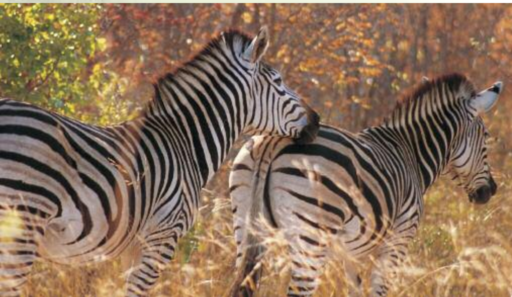
Stimmungsvolle Erlebnisse während vieler Safaris.

Die nächsten Reisetage gehören den schönen National- und Naturparks in der Region Natal. Von den Hügellandschaften Hluhluwes bis hin zu den Tiefebene des St. Lucia Wetland Parks. Auf Safaris, einer Nachtpirschfahrt und vor allem durch die Möglichkeit, Teile der Naturparks zu Fuß zu erkunden, bieten sich außergewöhnliche Beobachtungen und Entdeckungsmöglichkeiten. Es ist wie bei all unseren Reisen Zeit eingeplant, neben den großen Tieren auch den kleinen Naturwundern besondere Beachtung zu schenken. So sind das subtropische Klima mit seiner